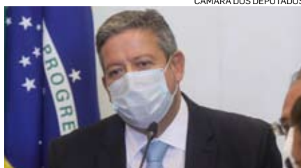
CÂMARA DOS DEPUTADOS

O presidente da Câmara, Arthur Lira (Progressistas-AL), classificou ontem como uma “trágica coincidência” a realização de um desfile militar nos arredores do Congresso, hoje, quando está prevista a apreciação pelos deputados da proposta de emenda à Constituição (PEC) do voto impresso. Alguns parlamentares disseram que a demonstração de força militar é uma tentativa de intimidação dos parlamentares. “Não é usual”, disse o presidente da Câmara sobre o desfile de tanques. “E, não sendo usual, em um país polarizado do jeito que o Brasil está, isso dá cabimento para