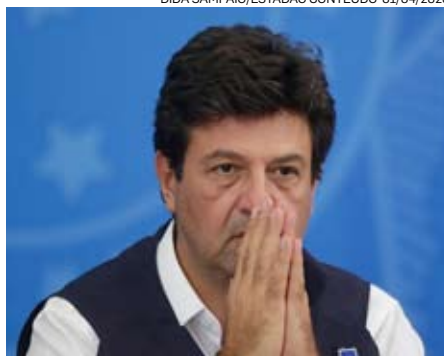
DIDA SAMPAIO/ESTADÃO CONTEÚDO-01/04/2020

Mandetta crê que o País ainda deverá viver o agravamento da pandemia, sobretudo pela sazonalidade do vírus, em