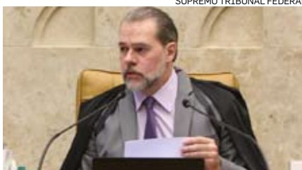
SUPREMO TRIBUNAL FEDERAL

O presidente do Supremo Tribunal Federal (STF), ministro Dias Toffoli , votou ontem por impor restrições ao compartilhamento de dados bancários e fiscais entre órgãos de controle e investigadores. Em um longo voto, Toffoli afirmou que a Unidade de Inteligência Financeira (UIF), antigo Coaf, pode informar autoridades sobre eventuais irregularidades, mas não pode atuar sob demanda do Ministério Público. Isso abre caminho para manter suspensa a apuração envolvendo o senador Flávio Bolsonaro (RJ) no esquema da “rachadinha” na Assembleia Legislativa do