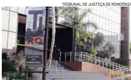
TRIBUNAL DE JUSTIÇA DE RONDÔNIA

Um grupo de 46 magistrados de Rondônia recebe um “bônus” de R$ 22 mil a R$ 42 mil em seus salários todos os meses, há dois anos. Os valores são referentes a uma ação que os juízes ganharam contra o Estado, por terem ficado dois anos sem receber os auxílios-moradia e transporte. No total, o Tribunal de Justiça de Rondônia vai desembolsar R$ 88 milhões, em valores corrigidos. Segundo o órgão, 24 parcelas de um total de 60 já foram pagas. Com o adicional, o rendimento líquido dos juízes de Rondônia variou de R$ 62 mil a R$ 227