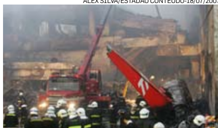
ALEX SILVA/ESTADÃO CONTEÚDO-18/07/2007

No dia do acidente, o avião modelo Airbus A320 partiu da cidade de Porto Alegre, com destino a São Paulo, e atingiu o prédio da TAM que ficava do outro lado do Aeroporto de Congonhas, na zona sul da capital.