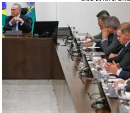
PRESIDÊNCIA DA REPÚBLICA