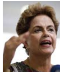
DILMA, SÃO PAULO/ESTADÃO/CONTINUED

Para ajustar o orçamento público, um eventual governo Temer terá de administrar um déficit que pode chegar a R$ 360 bilhões. Especialistas lembram, porém, de uma outra conta, oculta: a dos "esqueletos" que podem ser herdados da gestão de Dilma Rousseff - gastos ainda não contabilizados. Numa projeção conservadora, a conta pode passar de R$ 250 bilhões. A agência de classificação de risco Moody's estima, no pior cenário, um rombo de R$ 600 bilhões. As estimativas de gastos extras, feitas por especialistas de diversas áreas, incluem eventuais capitalizações que o Tesouro terá de fazer em estatais, negociação de dívidas dos Estados, risco de inadimplência com o Fies e manutenção do Fundo de Amparo ao Trabalhador. O especialista em contas públicas Mansueto Almeida diz que o gasto social, com previdência e pessoal é previsível, não deixou esqueletos. "Mas a política setorial deixou", afirma.