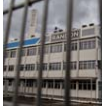
AVANÇADA PERIBEL ESTADÃO/CONTED

A produção industrial brasileira acumula queda de 8,7% nos últimos 12 meses até janeiro. É o maior recuo desde novembro de 2009, de acordo com dados da Pesquisa Industrial Mensal Produção Física Brasil do IBGE. Embora em janeiro tenha ocorrido um leve crescimento de 0,4% em relação a dezembro de 2015 - interrompendo um ciclo de sete meses seguidos de quedas -, não há esperanças de uma recuperação consistente para o ano. Com isso, a expectativa de analistas é que prossigam o fechamento de empresas em diversos segmentos da economia e as demissões de trabalhadores. Por causa da recessão, a fabricante de implementos rodoviários Randon vai paralisar a produção de sua unidade de Guarulhos (SP), que opera desde 1965.