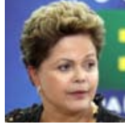
DILMA ROUSSEFF

Enquanto espera a aprovação pelo Congresso da recriação da CPMF e tenta fechar as contas de 2016, o governo optou novamente por aplicar aumento de tributos para reforçar a arrecadação. Por meio de decreto, instrumento que não precisa do aval dos parlamentares, a presidente Dilma Rousseff decidiu elevar impostos sobre sorvetes, chocolates, cigarros e rações a partir de maio. Na esteira de outros aumentos, o decreto de ontem altera a cobrança do Imposto sobre Produtos Industrializados desses produtos e, com isso, aumenta a arrecadação em R$ 641 milhões neste ano, R$ 1,07 bilhão em 2017 e R$ 1,02 bilhão em 2018. Desde o início do ano passado, o governo vem elevando uma série de tributos, o que tem gerado crítica de vários setores e do Congresso.