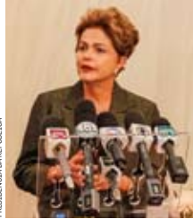
PRESIDÊNCIA DA REPÚBLICA

A presidente Dilma Rousseff disse ontem, em Estocolmo, que o ministro da Fazenda, Joaquim Levy, fica no cargo. "Ele não está saindo do governo. Ponto. Qualquer coisa além disso está ficando especulativo", afirmou Dilma, após encontro com o rei da Suécia, Carlos XVI, e a rainha Sílvia. Alvo de críticas do ex-presidente Lula e do PT, Levy disse a interlocutores na semana passada que pretende deixar o cargo até o fim do ano caso continue o "fogo amigo" contra ele. Dilma negou que o ministro tenha pedido demissão. "As pessoas que estão no ministério hoje espero que fiquem até o final do meu mandato. O resto é tentativa errada de especulação, porque cria instabilidade, cria tumulto." Indagada se concordava com o presidente do PT, Rui Falcão, que cobrou mudança da política econômica ou a saída de Levy, ela disse que ele "pode ter a opinião que quiser, mas não é a do governo". No Planalto, a avaliação é que a saída do ministro agora significaria admitir derrota do ajuste fiscal.