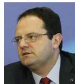
DILMA, SÃO PAULO/ESTADÃO/CONTINENTAL

O governo desistiu do compromisso de levar a inflação ao centro da meta, de 4,5%, ao fim de 2016. Na proposta de Orçamento enviada ao Congresso Nacional ontem, a estimativa é de que a alta de preços será de 5,4% em 2016 e de 4,5% em 2017. Assim, o Brasil completará sete anos consecutivos de inflação oficial acima do centro da meta. O Banco Central aumentou a taxa básica de juros seguidas vezes e vem alardeando, em seus comunicados, o compromisso de reduzir a inflação a 4,5% no ano que vem. Mas a proposta orçamentária do governo, chamada de "realista" pelo ministro do Planejamento, Nelson Barbosa , deixa claro que isso não ocorrerá. Análises de mercado estimam, segundo pesquisa do BC, que a inflação encerre o ano que vem em 5,51%.