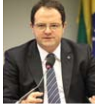
ED/REPÚBLICA/ESTADÃO/CONTÉUDO - 21/05/2015

O governo federal terá programas contínuos de concessões em infraestrutura, afirmou o ministro do Planejamento, Nelson Barbosa . Em entrevista concedida ontem ao jornal O Estado de S. Paulo, Barbosa disse que o objetivo do governo é manter leilões sistemáticos de rodovias, ferrovias, portos e aeroportos. "Estamos trabalhando para que isso seja uma atividade contínua no Brasil. Vamos fazer isso agora em 2015 e no ano que vem", disse Barbosa. O ministro não negou os desentendimentos com o colega da Fazenda, Joaquim Levy, mas disse que foram divergências normais e pontuais em um processo de política econômica. "Os diretores do Banco Central também divergem nas reuniões do Copom (Comitê de Política Monetária)", comparou.