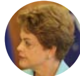
DILMA ROUSSEFF/AGÊNCIA CONTRAFOTO

O governo Dilma Rousseff pretende apresentar, em junho, uma proposta que acaba com o fator previdenciário, mas muda o cálculo para a obtenção da aposentadoria. Feito para ser uma alternativa à fórmula aprovada pelo Senado, o plano é tornar flexível a idade mínima de acesso ao benefício pago pelo INSS, de acordo com índices de expectativa de vida do brasileiro. O grupo de trabalho do governo que avalia a alternativa deve apresentá-la nos próximos dias a representantes do Fórum Nacional da Previdência Social.