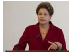
03/07/2015

O governo anunciou que aceita negociar o ajuste fiscal com partidos e centrais sindicais, incluindo mudanças no seguro-desemprego, para que ele seja aprovado o mais rapidamente possível no Congresso. Segundo o ministro da Previdência, Carlos Gabas, todos os itens das Medidas Provisórias 664 e 665, que alteram as regras de concessão de benefícios sociais e estão em tramitação, são passíveis de discussão. "Não há nada fechado. Todos os temas estão em debate", disse, após reunião em que Michel Temer estreou na coordenação política. Também ontem, a presidente Dilma Rousseff lançou uma estratégia de comunicação para defender o ajuste. Assessorias de imprensa de órgãos do governo receberam a cartilha Ajustar para Avançar, que pretende padronizar o discurso oficial. Haverá ainda campanha no rádio e na TV e "reestruturação" das redes sociais. A expectativa da área econômica é de que o contingenciamento chegue a R$ 80 bilhões.