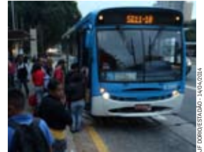
UF. EDUARDO ESTADÃO - FAP/2015/04

Com custo superior a R$ 100 bilhões, a licitação dos ônibus de São Paulo poderá ter contratos com vigência de até 20 anos, segundo o secretário municipal dos Transportes, Jilmar Tatto. O futuro sistema de coletivos da capital também será redesenhado e terá quatro sub-redes de deslocamento - radiais, perimetrais, de articulação e de distribuição. As propostas foram apresentadas ontem durante uma conturbada audiência pública presidida por Tatto no Instituto de Previdência Municipal (Iprem), em Santana, zona norte. O encontro tratou da concessão, prevista para ser viabilizada pela gestão Fernando Haddad (PT) até julho. De acordo com Tatto, a divisão do sistema em duas redes - estrutural e local - será mantida, mas serão quatro variações: duas sub-redes estruturais e duas sub-redes locais.