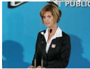
OTDA SAMPAIO/ESTADÃO - 28/03/2007

"Estive com a presidente pessoalmente quando ela era diretora de Gás e Energia. Naquele momento foi passada documentação de uma denúncia na área de comunicação e ela teve acesso a essas irregularidades nas reuniões da diretoria executiva", disse a ex-gerente. Venina afirmou não ter sido a única funcionária de alto escalão a presenciar atos ilícitos na empresa e convocou outros colegas a contar o que sabem.